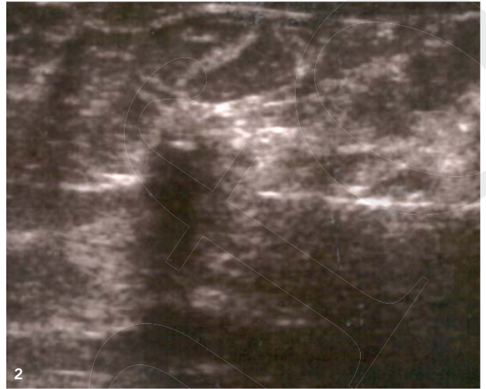
Abb. 2: Ultraschall kontrollierte Stanzbiopsie eines Karzinoms