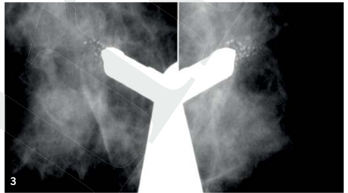
Abb. 3: Stereotaktische Biopsie; In einem Winkel von +15 und -15 Grad wird ein Mammographiebild hergestellt und computerunterstützt die Lokalisation des Befundes in der Brust genau berechnet

vität durch die Punktion unter Ultraschallkontrolle verbessert werden. Zudem kann durch die Bildgebung der korrekte Sitz der Nadel in der Läsion dokumentiert werden. In Tabelle 3 wird der Unterschied zwischen FNP und Stanzbiopsie zusammengefasst.