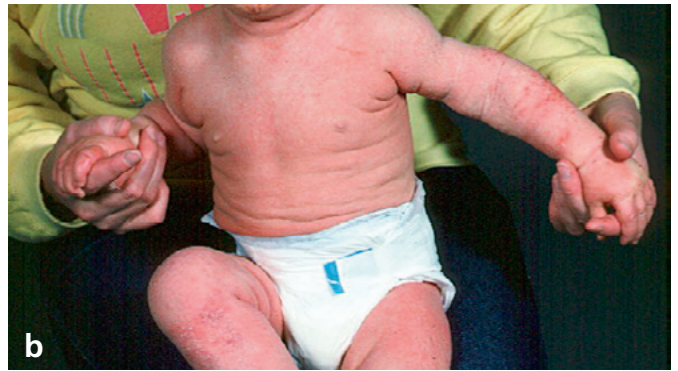
Foto 4: Nella scelta della terapia si dovrebbe distinguere tra la forma nummulare (a) e la forma generalizzata (b).

Per l'eczema atopico nella prima infanzia tuttavia, il principio «ungere, ungere, ungere» dovrebbe essere considerato in modo differente a seconda della morfologia, ha affermato Kernland-Lang.