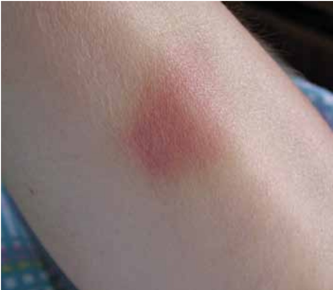
Abb. 2: Hautveränderungen können sich z.B. in Form von Ekchymosen oder Suffusionen manifestieren