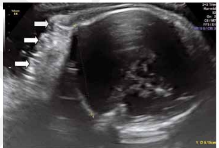
Fig. 2: Cutis girata chez un fœtus à 37 SA

Le risque d'atteinte fœtale sévère semble maximal lors d'une infection maternelle au premier trimestre. Ce risque était estimé au départ à 29% dans une cohorte de patientes symptomatiques (22). Des modèles mathématiques par la suite l'ont estimé entre 0.8 et 13% (23,24). Les dernières données montrent un risque d'atteinte fœtale sévère de 6%