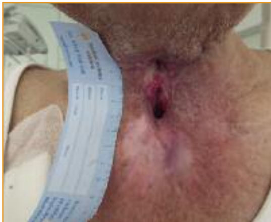
Abbildung 2: Ansprechen nach erstem Zyklus mit Pembrolizumab