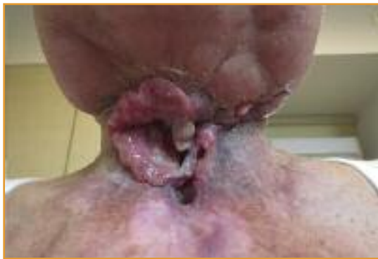
Abbildung 1: Lokalzidiv eines Larynxkarzinoms vor Therapie