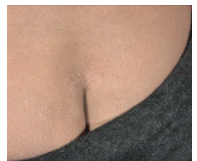
Abbildung 8: Milde psoriatische Beteiligung der Sakralregion bei einem Mädchen