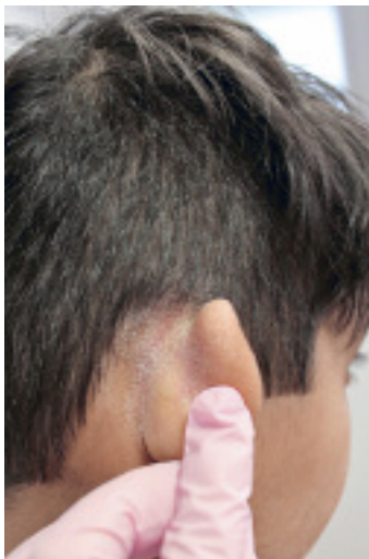
Abbildung 14: Retroaurikuläre Psoriasis bei einem Jugendlichen

Auch wenn die Wirksamkeit einer Fototherapie bei der Behandlung der Psoriasis auch bei Kindern belegt ist, sollte sie aufgrund des Risikos der Fotokarzinogenese vor dem 12. Lebensjahr gar nicht eingesetzt werden und bei älteren Kindern Ausnahmefällen vorbehalten sein. Eine PUVA-Therapie (Psoralen in Kombination mit UV-A) ist im Kindesalter kontraindiziert.