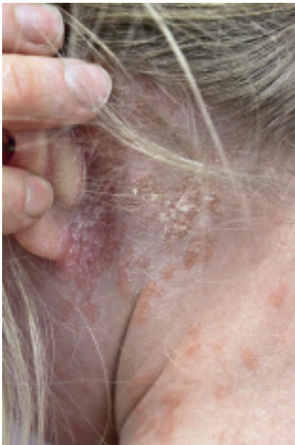
Abbildung 4: Kopfhautbeteiligung bei einem Jungen