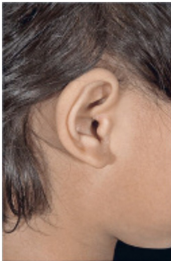
Abbildung 13: Psoriatische Gehörgangsbeteiligung bei einem Mädchen