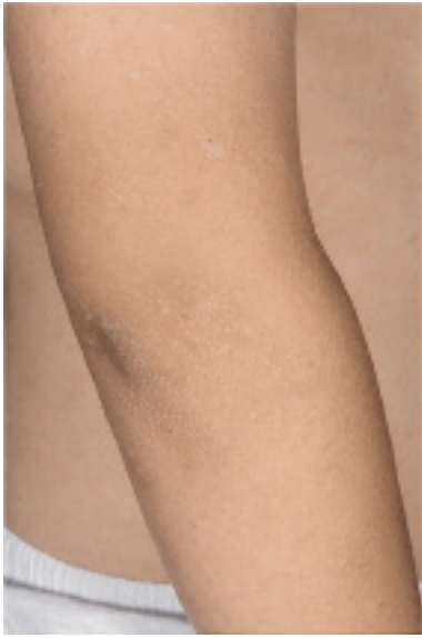
Abbildung 10: Psoriasis bei einem Jungen (erst die Inspektion von Nabel und Rima ani sichern die Diagnose)