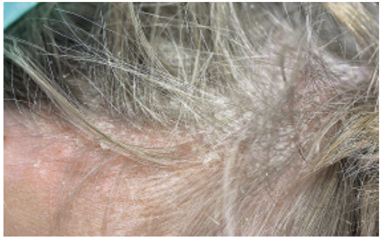
Abbildung 5: Kopfhautpsoriasis bei einem Mädchen mit Psoriasis guttata

Für die spezifische Therapie stellt Calcipotriol auch im Kindesalter das Mittel der ersten Wahl dar, eingesetzt entweder als Monotherapie oder in Kombination mit einem topischen Steroid. Das Vitamin-D-Derivat wirkt differenzierungsfördernd. Calcipotriol ist in Deutschland ab 6 Jahren zugelassen. Die Calcipotriol-Betamethason-Kombipräparate Daivobet®, Xamiol® und Enstilar® sind in der Schweiz nur für Erwachsene zugelassen. Tacalcitol (Curatoderm®) ist ab 12 Jahren zugelassen. Es darf aufgrund der Gefahr einer Hyperkalzämie bei Resorption nach grossflächiger Applikation auf maximal 30 Prozent der Körperoberfläche aufgetragen werden. Da es ausserdem irritativ wirken