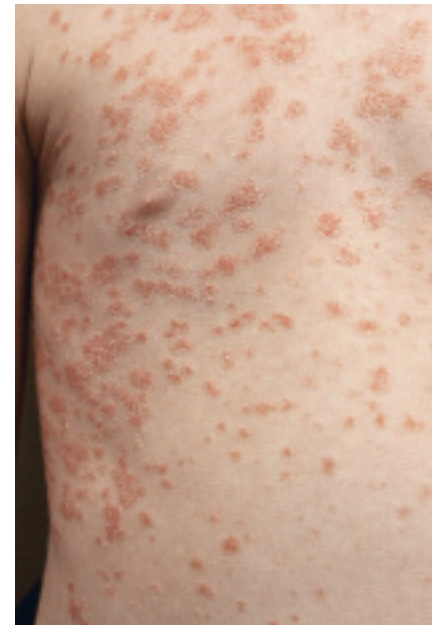
Abbildung 1: Psoriasis guttata nach Streptokokkeninfekt

Ebenfalls von Bedeutung ist im Kleinkindes- und Säuglingsalter die sogenannte Windelpsoriasis (Abbildung 3). Bei 4 Prozent der Patienten dieser Altersgruppe ist nur die Windelregion befallen, bei zirka 13 Prozent die Windelregion neben anderen Körperstellen. Retrospektiv lässt sich aber eine viel häufigere Beteiligung ausmachen, da die Eltern bei einem Viertel der an Psoriasis erkrankten Kinder auch einen Befall der Windelregion zu früheren Zeiten angeben (8). Vermutlich spielt der isomorphe Reizeffekt eine Rolle, also eine Triggerung durch mechanische Reizung der Windel und durch Stuhl und Urin. Im Gegensatz zur Candida-getriggerten Windel-dermatitis fehlen Satellitenherde. Eine Rarität stellt die lineare Blaschko-Psoriasis dar. Kinder weisen sehr häufig eine Gesichts- und/oder Kopfhautbeteiligung der Psoriasis auf. Auch geben sie häufig Juckreiz an (Abbildung 4 bis 6).