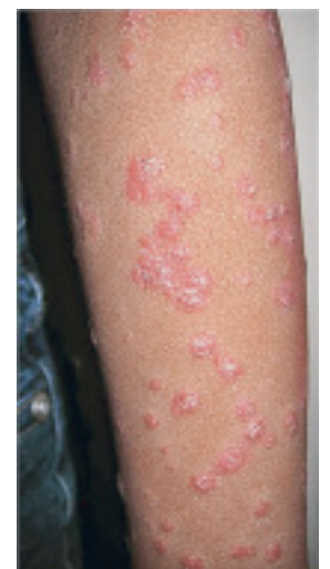
Abbildung 2: Psoriasis guttata nach Streptokokkeninfekt