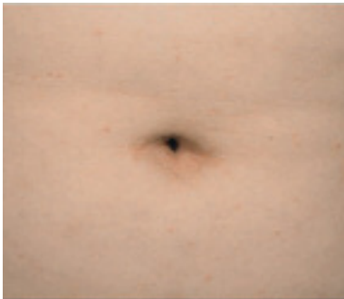
Abbildung 11: Nabelbeteiligung bei einem Jungen mit Psoriasis