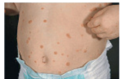
Abbildung 6: Juckreiz bei Psoriasis

Cignolin (Dithranol) wird in der Psoriasisstherapie bereits seit mehr als einem Jahrhundert eingesetzt. Es ist jedoch in der Anwendung einem stationären Rahmen, tagesklinischem Setting oder einem in der Anwendung der Substanz erfahrenen Arzt in Zusammenarbeit mit sehr kooperativen und differenzierten Eltern vorbehalten, da in der Kurzkontakttherapie täglich die Anwendungsdauer und im Verlauf die Konzentration der Substanz erhöht werden. Dennoch zeigen sich auch in aktuellen Studien gute Ansprechraten (17), sodass auch diese Substanz weiterhin für bestimmte Patienten als geeignetes Antipsoriatikum gelten kann. Eine fast immer auftretende lokale Irritation sollte bei fachgerechter Therapie nicht zu stark ausgeprägt sein und keinen Grund für einen Therapieabbruch darstellen. Die Anwender müssen über das mögliche Problem der Braunverfärbung (Kleidung, Badewanne) informiert werden. Dithranolpräparate sind in der Schweiz nicht mehr im Handel. Sie können aus Deutschland importiert oder als Magistralrezepturen von Apotheken bezogen werden.