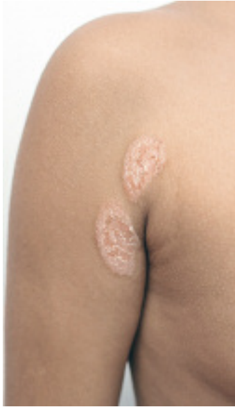
Abbildung 12: Psoriasis inversa bei einem Jugendlichen