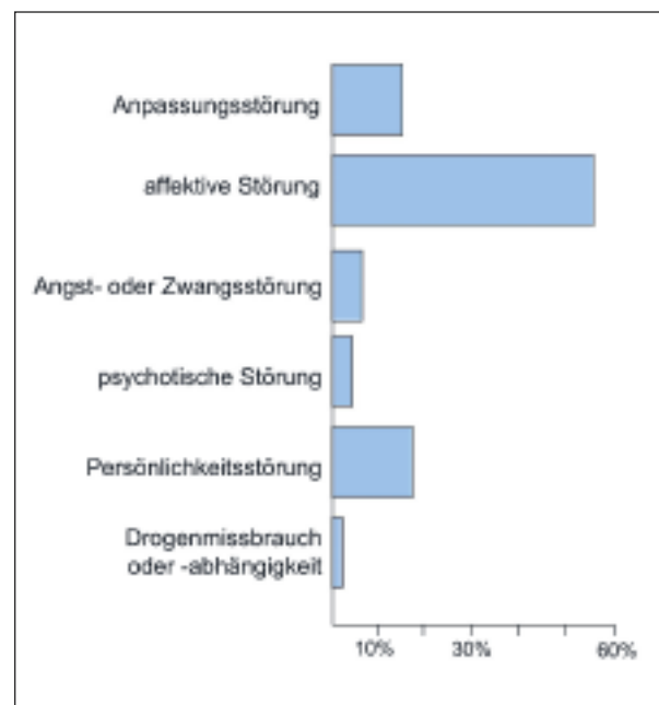
Abbildung 1: Hauptdiagnosegruppen der Mütter bei Eintritt an der Psychiatrischen Klinik Münsterlingen (2007 bis 2013)

Entscheidend für die gemeinsame Hospitalisation ist die Fähigkeit der Eltern, sich ihrem Kind noch ausreichend zuwenden zu können (Abbildung 1). Selbstverständlich stehen die Mitarbeiter des Pflorgeteams 24 Stunden für notwendige Unterstützungsangebote zur Verfügung, dennoch sollen die Eltern die zentralen Bezugspersonen bleiben. Wenn dies nicht möglich ist, beispielsweise bei akuter Psychose oder akuter Suizidalität, wird eine gemeinsame Hospitalisation zum Wohl des Kindes in Münsterlingen nicht angeboten. Inhaltlich beruht das stationäre Behandlungsangebot auf einer interdisziplinären Zusammenarbeit von Kin-