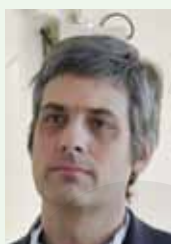
Pr P. Fontana