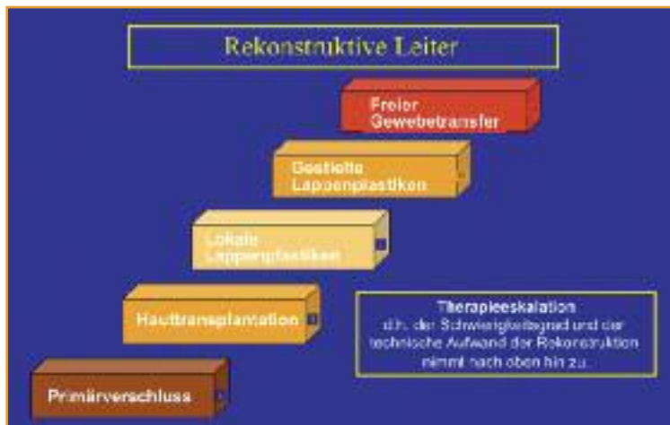
Abbildung 1: Das Rekonstruktionsverfahren in der Gesichtschirurgie wird entsprechend der rekonstruktiven Leiter gewählt.

Die Periokularregion ist am anspruchsvollsten, da die