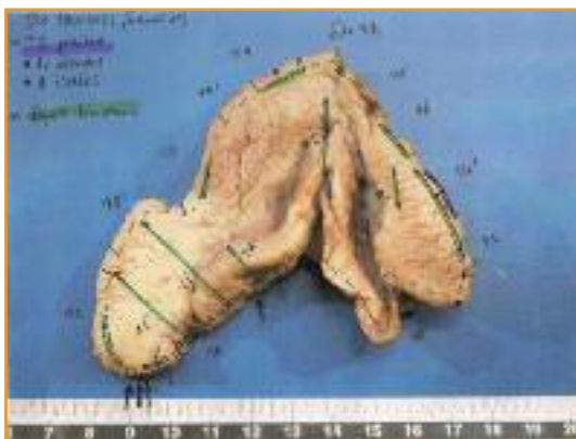
Abbildung 1c: Vulvektomiepräparat. An allen Schnitt-rändern finden sich noch Tumorzellen.

Zwischen 2003 und 2014 sind uns insgesamt 5 Patienten mit EMPD zugewiesen worden. 3 Frauen wiesen rezidivierende Verläufe bei primärem Vulvabefall auf, sie wurden entweder nach mehrfachen, teilweise ausgedehnten Operationen zur postoperativen Bestrahlung bei R1/R2-Situationen oder bei erneuter Tumorprogredienz der Radiotherapie zugeführt. 1 Patient wies eine scrotale Manifestation auf, 1 weiterer Patient eine perianale Manifestation, und beide erhielten eine alleinige Radiotherapie. Von einer Patientin ist anamnestisch ein Mammakarzinom bekannt, das 1987 erfolgreich brusterhaltend behandelt wurde, ohne einen weiteren Tumornachweis. 3 Patienten hatten einen primären EMPD ohne Tumoranamnese. Der Mann mit dem Skrotumbefall wurde Jahre zuvor mit einer radikalen Prostatektomie bei Prostatakarzinom behandelt, auch hier gab es keine