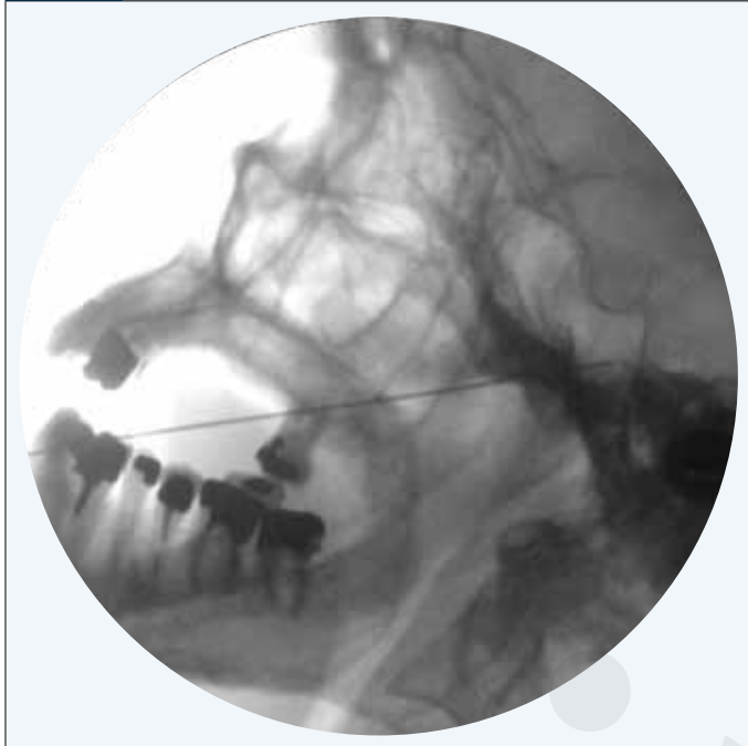
FIG. 3 La radiofréquence thermique du ganglion de Gasser

après avoir effectué une épидurographie proposer au patient une décompression minimalement invasive percutanée sous la forme d'une laminotomie percutanée de type MILD® (14) (fig. 2).