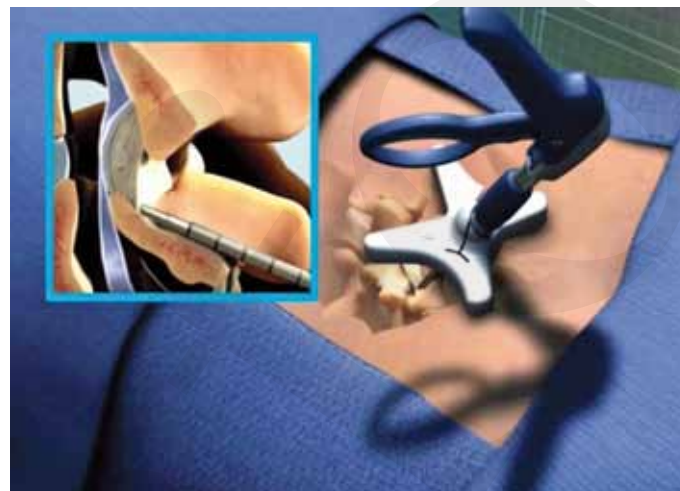
Fig. 2: Décompression minimalement invasive percutanée sous la forme d'une laminotomie percutanée de type MILD®

L'évaluation de la douleur est basée sur les recommandations internationales (8,9) et comporte l'évaluation de l'intensité, de la qualité et de la fonctionnalité physique et émotionnelle.