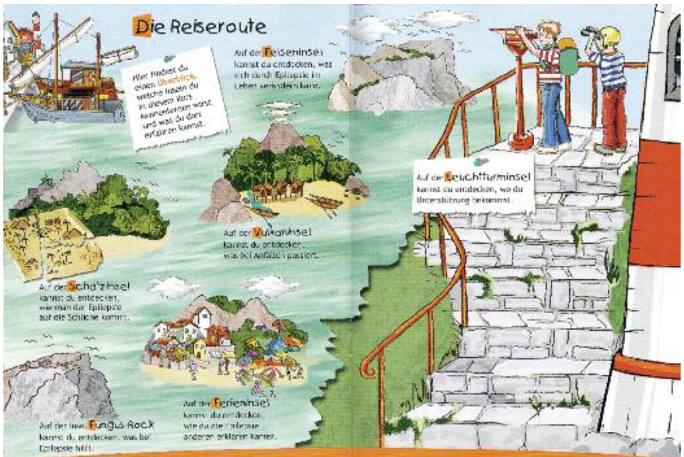
Abbildung 1: Die virtuelle Schiffsreise bringt die Kinder zu verschiedenen Inseln mit Informationen zur Epilepsie und Tipps für den Alltag (aus Kursbuch famoses; Abdruck mit freundlicher Genehmigung des Bethel-Verlags Bielefeld).

mit Epilepsien angestrebt, wie es in etlichen deutschen Epilepsiezentren bereits «zur Routine» gehört.