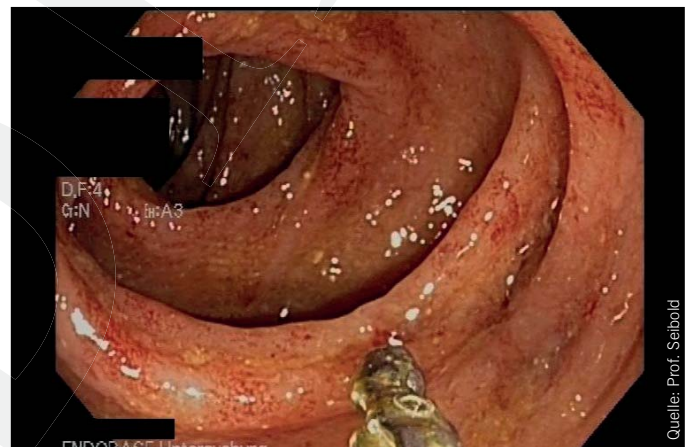
Abb. 1: Typischer endoskopischer Befund bei ischämischer Kolitis: livide aufgeschwollene Schleimhaut mit punktförmigen Schleimhauteinblutungen

Die Revaskularisation kann entweder endovaskulär (perkutane transluminale Angioplastie (PTA) mit Stenteinlage) oder operativ (offen-chirurgische Rekonstruktion) erfolgen. Ein Problem der PTA sind die häufigen Rezidivstenosen. Die Offenheitsrate kann jedoch durch Wiederholung der Intervention deutlich gebessert werden (7). Postoperativ ist eine Therapie mit Thrombozytenaggregationshemmern oder bei langstreckigen Rekonstruktionen mit Prothesen oder autologen Venen mit einer oralen Antikoagulation indiziert.